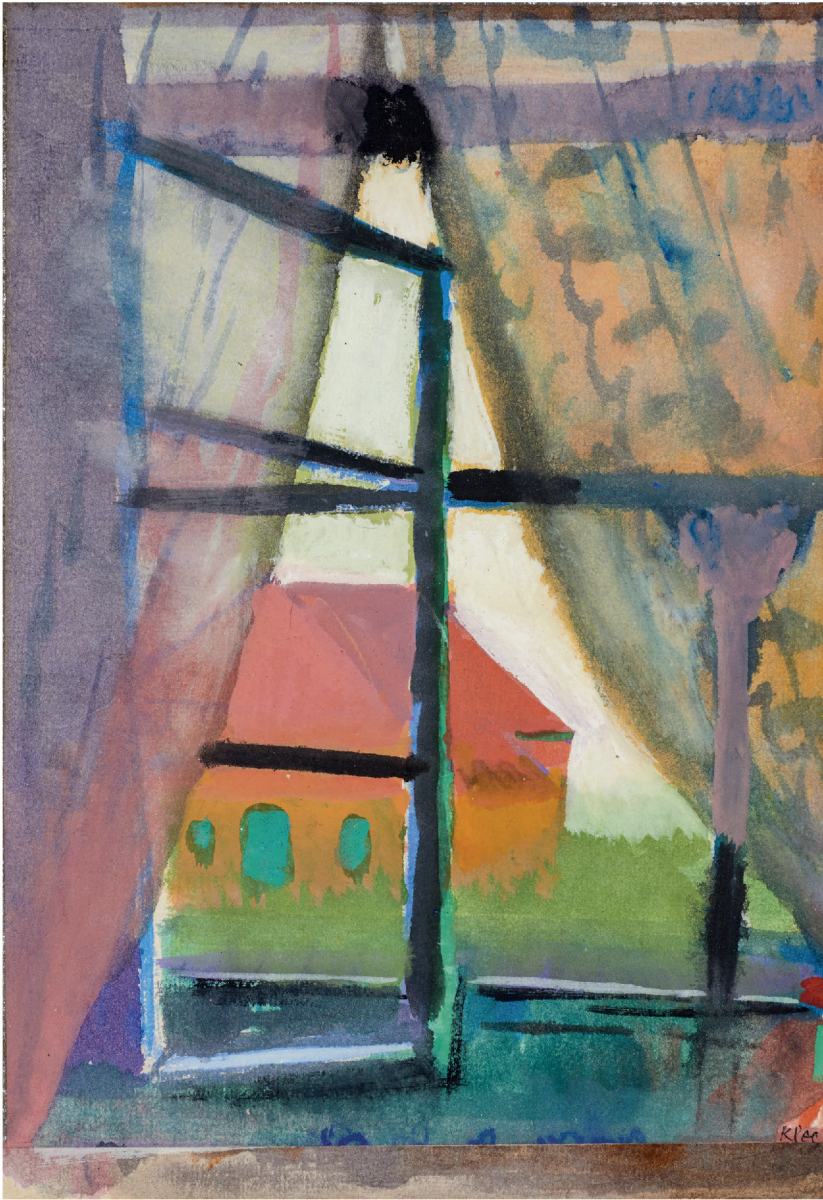
Zentrum Paul Klee, Bern und Kunstmuseum Bern

Sommerurlaub auf Baltrum 1923 Nordseebilder